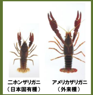
ニホンザリガニ (日本固有種)